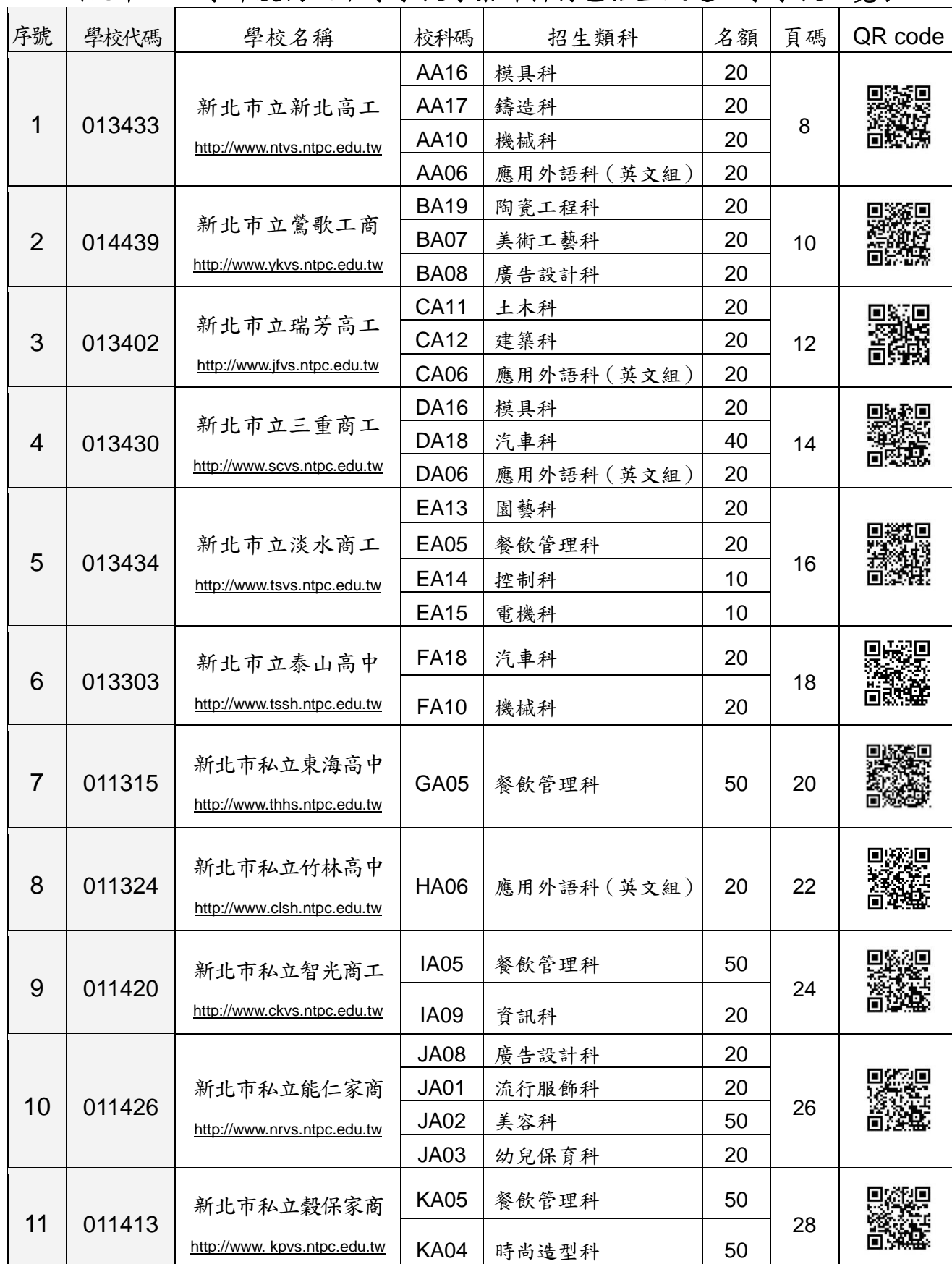
新北市 105 學年度高級中等學校專業群科特色招生甄選入學學校一覽表