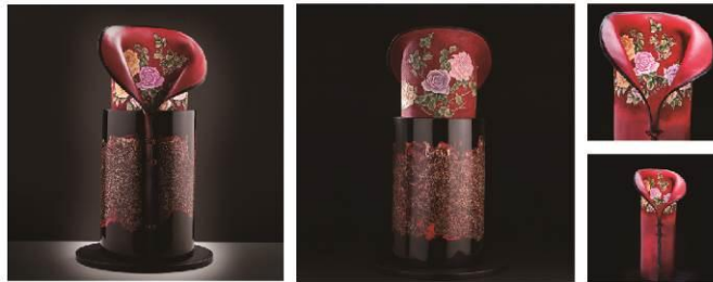
In the exhibition, more than 50 pieces of recent works by the artist are displayed, including "Lady Zhen". 2018 A' Design Award winner in the Arts, Crafts and Ready-Made Design Category.

本展覽展出50多件馮斯蒂女士近期作品，其中「瑰姿艷逸，儀靜體閑」，是今年度A' 設計大獎 從100個國家、地區，99個不同設計領域的「藝術工藝」類中，由極具國際影響力的知名學者、 媒體、設計人士和企業家組成的評審團，進行評鑑而獲得銅獎的作品。