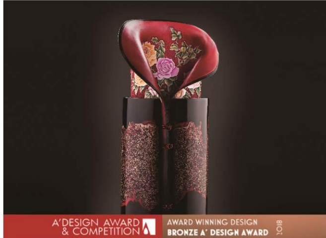
2017-2018 A' 設計大賽「藝術工藝類」銅獎 Bronze A' Design Award Winner In Arts, Crafts and Ready-Made Design Category, 2017-2018