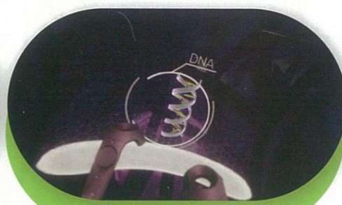
The Body VR(健護/醫學)