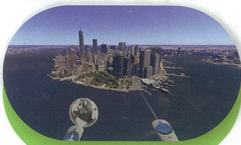
Google Earth VR(地理/歷史)