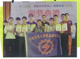
106學年全國技藝競賽獲全國第一、二名 5年內獲7座高職全國第一獎座