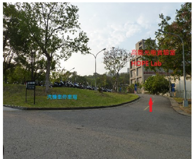
5. 原子爐→汽機車停車場